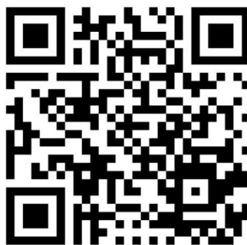
（北京化工大学研究生家庭经济情况调查问卷二维码）